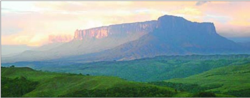
El soberbio Kukenán también deslumbra a los visitantes