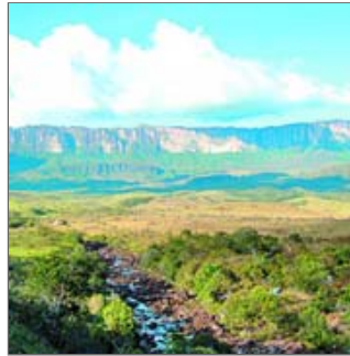
Así luce el Roraima desde el río Tek

Más adelante, incluso tras haber parado para almorzar a mitad de la escarpada, llegamos al Paso de Lágrimas, el tramo más difícil de todo el viaje. El terreno está muy inclinado, y uno debe caminar sobre grandes piedras sueltas, asegurando cada paso, pues una caída podría ser muy peligrosa. Para colmo, desde lo alto de la pared cae sin parar un suave rocío, a veces fuerte llovizna, que nos moja y humedece las rocas haciendo todo más complicado.